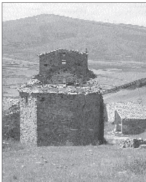
El museo etnográfico guarda "lo único antiguo que queda del pueblo". Junto a él, numerosos rincones de naturaleza y patrimonio rural

La asociación trabaja en el aspecto cultural, organizando ciclos de verano, exposiciones, conferencias,